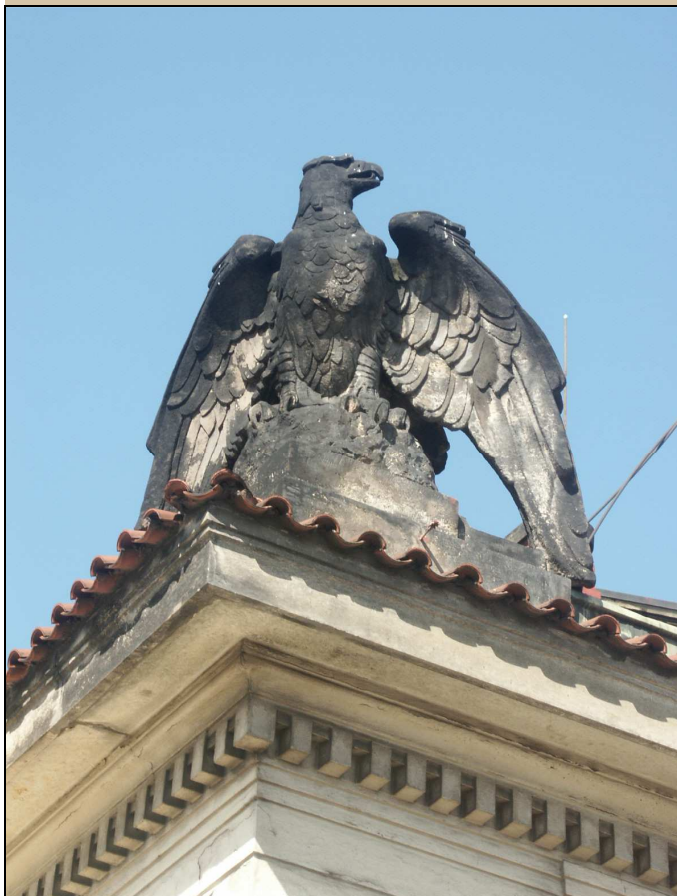
pohled na plastiku sedícího orla